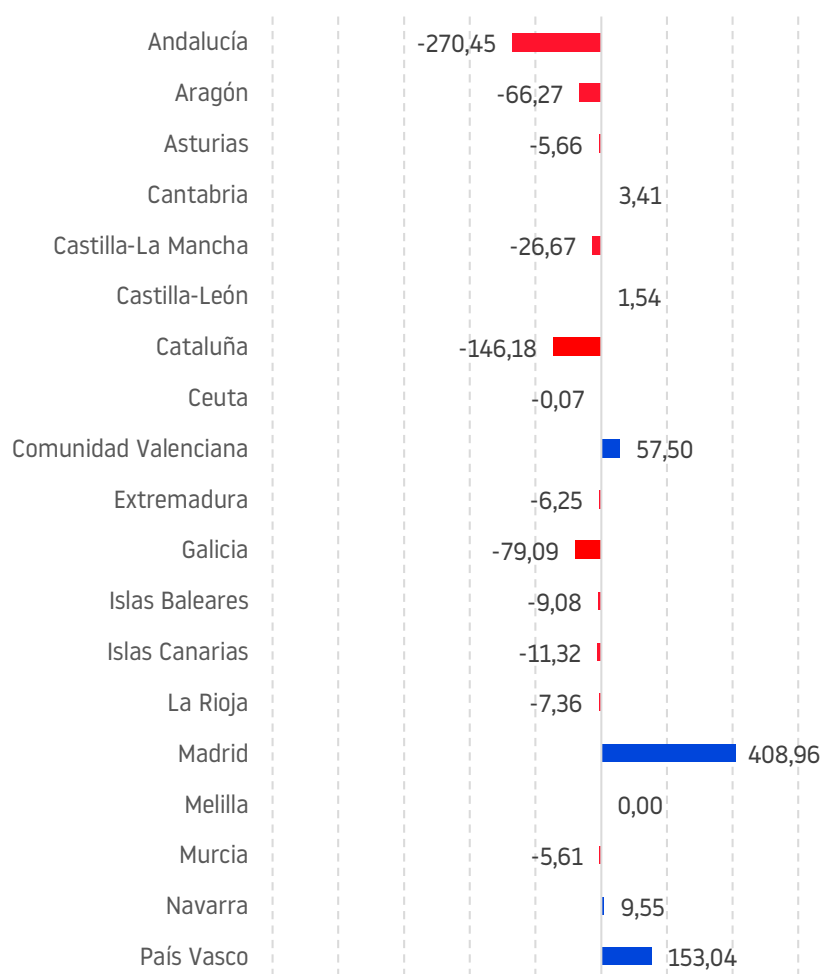
SALDOS TOTALES SEGÚN FACTURACIÓN (millones de euros 2020)

salidas de Oliva petroleum S. A. , Albacora S. A. y Aceisur 2010 S. L. , que sumaban más de 240 millones de euros de facturación.